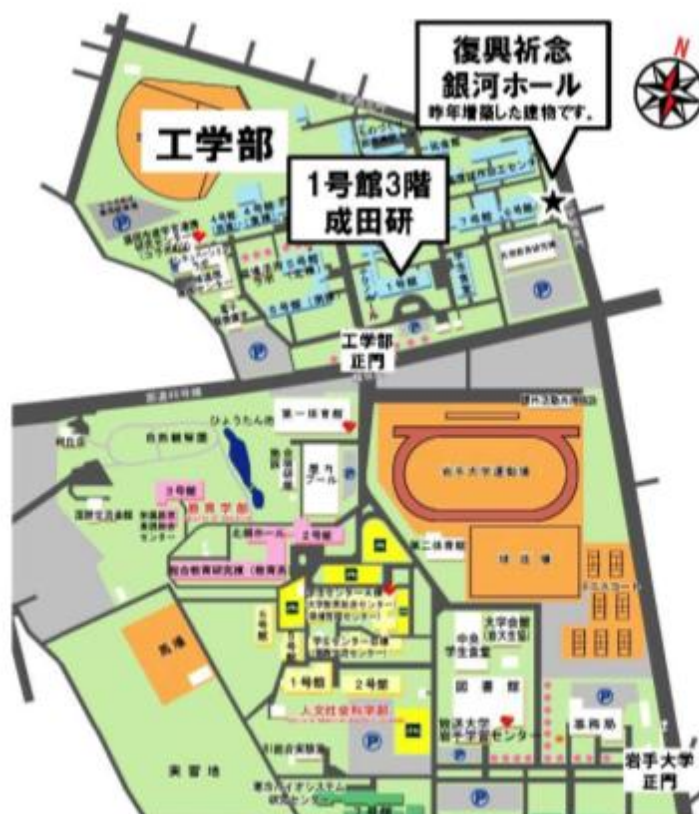
岩手大学キャンパスマップ

講義・実験・卒業研究などで利用した5号館（応化棟）は来年度改修予定です。見学する方はお早めに来学ください。